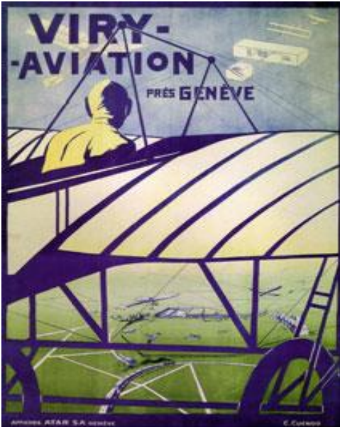
Affiche du meeting de Viry (1910).