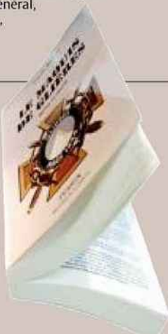
« Le maquis de Glières », Claude Barbier, Perrin, 24,50 €.

Le maquis de Glières, entre mythe et réalité. Les archives désormais disponibles permettent d'éclairer sous un jour neuf, cet épisode ô combien symbolique de l'histoire de la France, et de remanier la trame légendaire véhiculée par une littérature plus encline à privilégier la mémoire que l'histoire (on considère encore le plateau des Glières comme le lieu de « la première bataille de la Résistance »). L'ouvrage de Claude Barbier, au-delà de cette recherche exemplaire et objective, amène aussi le lecteur à s'interroger sur les maquis en général, leur environnement, leurs forces mais aussi leurs faiblesses.