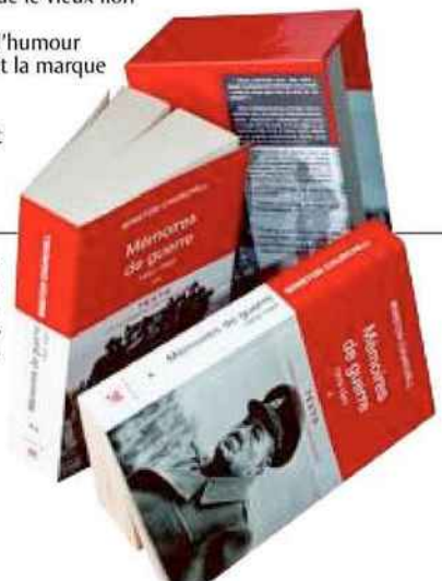
« Mémoires de guerre, 1919-1941 et 1941-1945 », par Winston Churchill, collection Texto, Taillandier, 25 €.